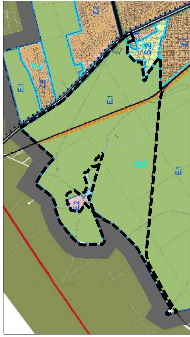
WYRYS ze Studium uwarunkowań i kierunków zagospodarowania przestrzennego miasta Torunia